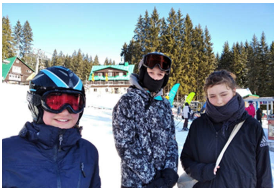
... a bylo možné lyžovat na sjezdovkách, na snowboardu či se věnovat zimní turistice.