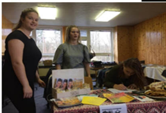
Snídaně na závěr epochy němčiny ve 2. Ročníku